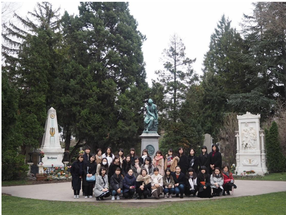
3月13日 ウィーン共同墓地名誉地区A32 ベートーヴェン等大作曲家の墓の前で