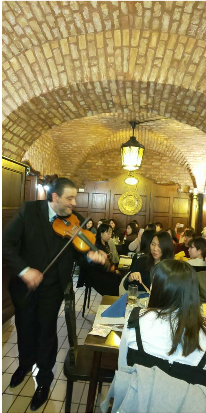
ウィーン最後の夜 ホイリゲにてお夕食& wine/ juice を楽しみました。