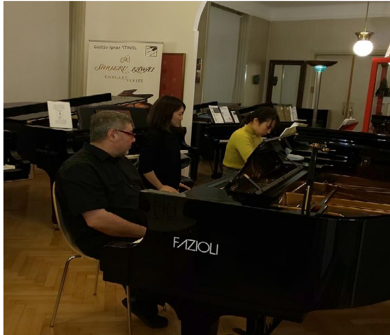
ウィーン国立音楽大学教授 アヴォ・クユムジャン