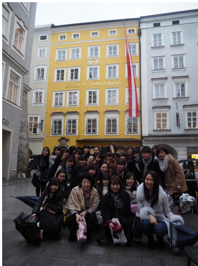
3月15日 ザルツブルクにて