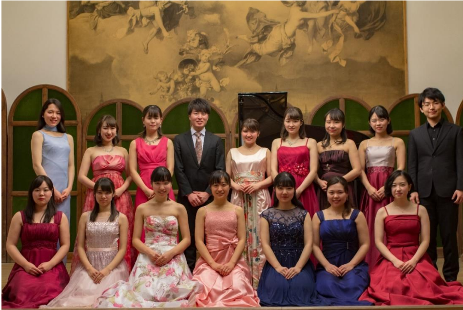
3月12日 音楽会 リスト記念館ホールにて